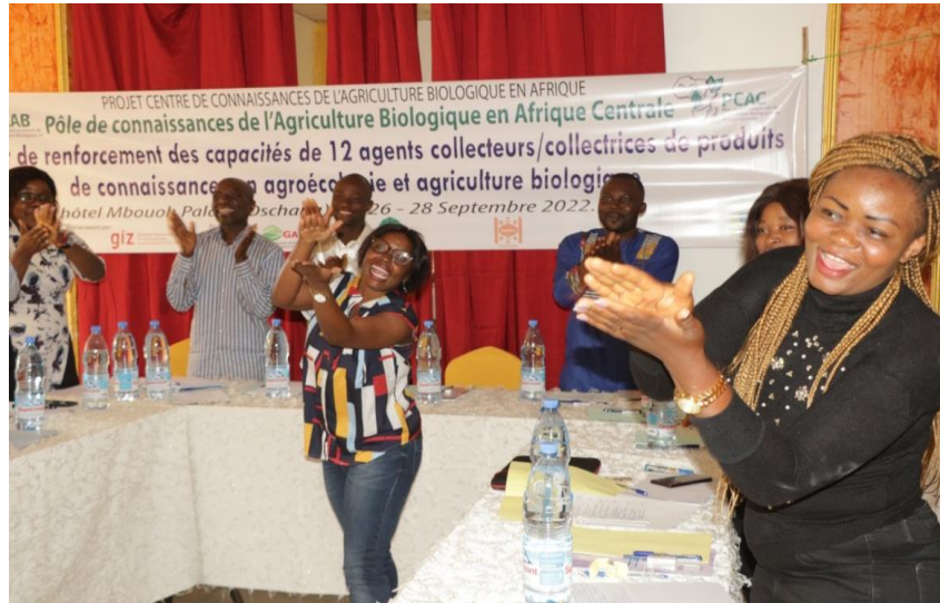
Brise-glace avec les participant.e.s