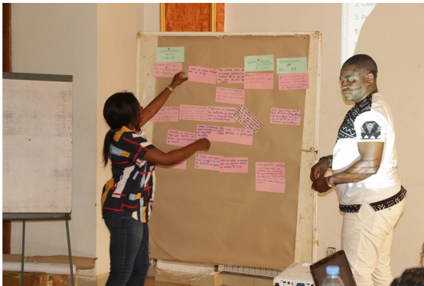
Recueil et échanges sur les attentes des participant.e.s