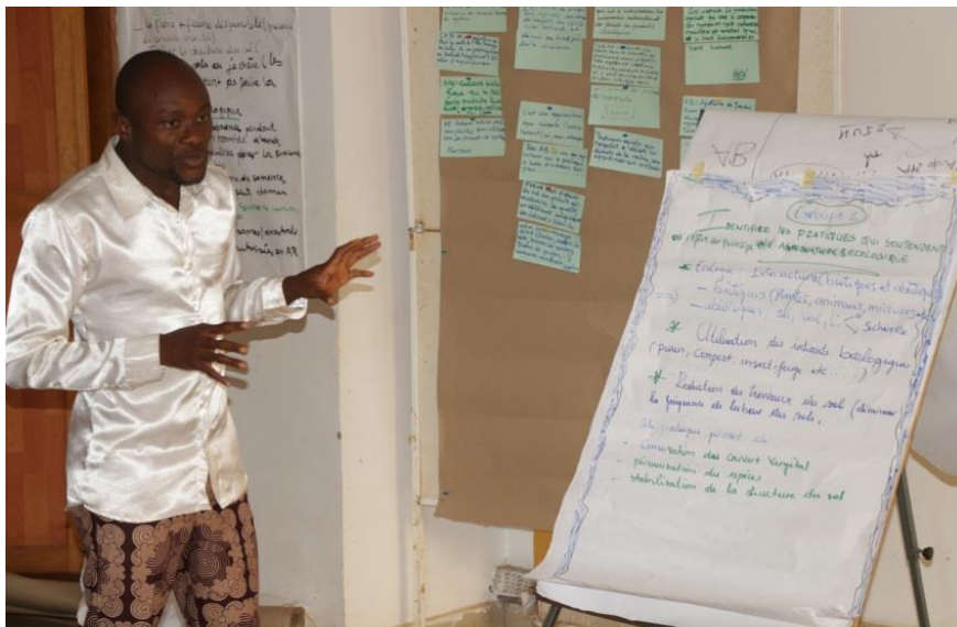
Restitution en plénière des travaux de groupe

La journée s'est terminée avec les questions de propriétés intellectuelles. Ici, des Informations rapides ont été fournies sur le cadre légal des produits des connaissances au Cameroun, la nature des droits de la propriété intellectuelle, les formes et les mécanismes du droit d'accès aux connaissances. Nous avons insisté sur les outils du KCOA au sujet des DPI. L'examen des formulaires et fiches techniques du Centre de Connaissances en Agriculture Biologique (CCAB) aura servi d'indicateurs pour les modalités éthiques dans la collecte des connaissances. Les connaissances données par les sources doivent ainsi être faites en connaissance de cause. Aussi les communautés- sources doivent-elles donner leur accord de façon expresse pour que les informations données soient exploitées, diffusées ou reproduites.